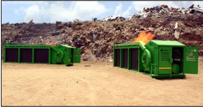
S-116 Relleno Sanitario en el Caribe

El equipo fabricado a medida incluye una Caja de Quemado con motores eléctricos y los Quemadores de Trinchera o Zanja vienen sobre correderas en vez de ruedas.