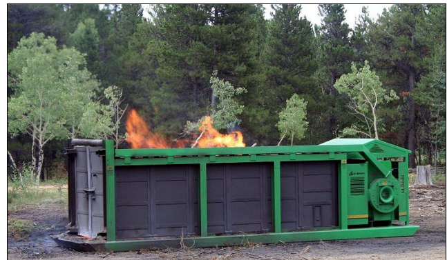
S-220 (Rocky Mountain National Park, EE.UU.)