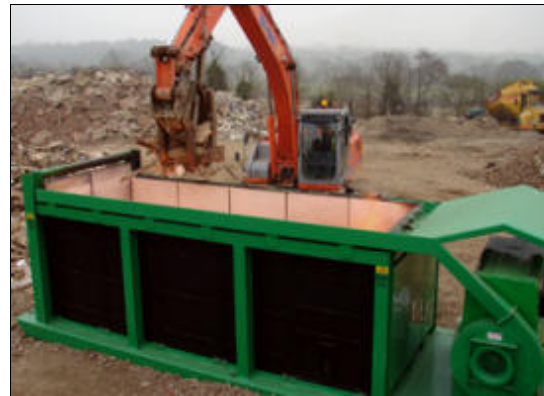
Serie S (S-217 en Inglaterra)

Estas máquinas no inyectan combustible al fuego sino que éste se mantiene agregando más residuos de madera. El aire de la Cortina no es calentado. El único combustible utilizado en la operación continua es el que mueve el motor Diesel y que activa al ventilador. Ideal para la quema de madera luego de limpieza de lotes, construcción, tala de bosques, árboles infectados con plagas, productos de madera de fabricación o desastres naturales (huracanes, tormentas, inundaciones, etc). El volumen de reducción logrado alcanza el 98%.