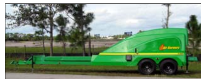
Serie T (T-400)

El Quemador móvil de Trinchera o Zanja como el T-400 (ver foto) viene montado sobre un remolcador. En la zona de operaciones se hace una zanja en la tierra y allí se depositan los residuos a quemar. Una vez que se ha encendido el fuego se activa la cortina de aire que genera un 'tapa' sobre la zanja evitando que las partículas escapen y además agrega oxígeno a la quema haciéndola más eficiente.