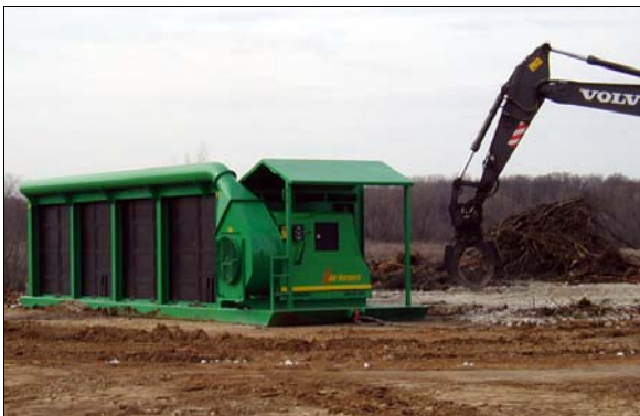
S-327 (Tennessee Relleno Sanitario, EE.UU.)